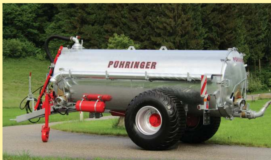
Einachs-Vakuumfass mit Y-Deichsel und Untenanhängung