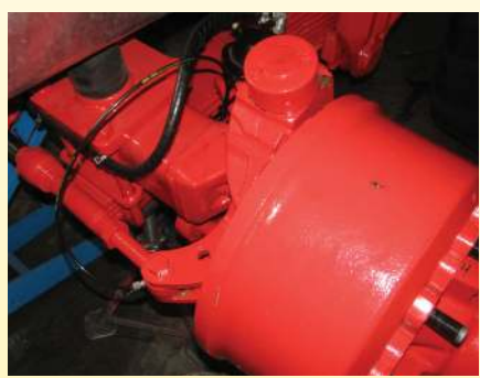
Gefedertes Boogieaggregat mit hydraulischer Nachlauf- oder Zwangslenkung und Zentralschmierung