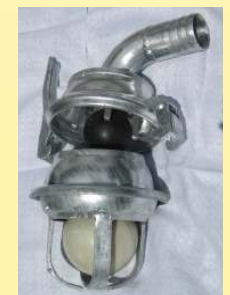
Domventil mit 2-Kugelsystem u. Schnellverschluss