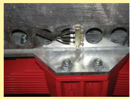
Zentralschmierung mit Schmierleiste (auch mit autom. Zentralschmierung ausrüstbar)