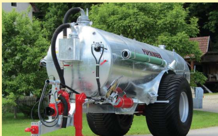
Vakuumfass mit Untenanhängung u. Radkästen

hydr. Bremse, hydr. Deichselfe- derung mit Gas- druckdämpfer, Prallkopfverteiler