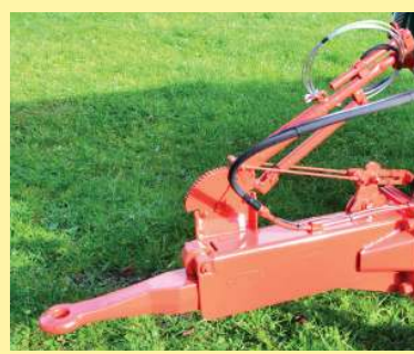
Bremssysteme • Druckluft-Bremsanlagen • Hydr. Bremsanlagen • Auflaufbremse bis 8to G.Gew. (BRD)