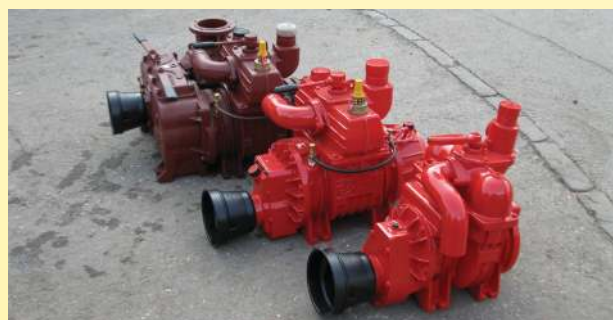
Kompressoren • Leistungsstark • Robust • Langlebig • Zwangsschmierung mit Exzenterpumpe • geringer Ölverbrauch